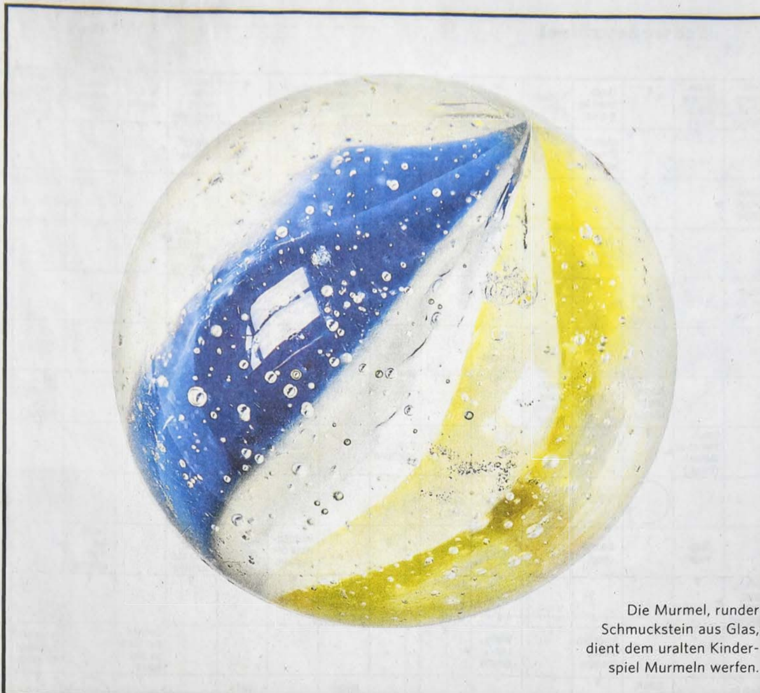
Die Murmel, runder Schmuckstein aus Glas, dient dem uralten Kinderspiel Murmeln werfen.