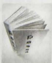
Michael Bilek: Passé . Die stille Ästhetik der dahingehenden Objekte. Fotografiert von Andrea Wittstruck. Edition Mixtumcompositum, Esslingen. 210 Seiten, 95 Euro

Um manches wäre es schade, das erkennt der Leser des Fotobuches „Passé“ schon beim Betrachten des ersten von 100 Objekten, die in dem Buch zu sehen sind. Eine Armbanduhr mit serifenlosen Ziffern, leicht verschrappt, aber elegant. Kenner wissen, dass dieser Zeitmesser nicht nach dem ehemaligen US-Präsidenten benannt wurde, sondern Clinton eine Marke aus Chicago