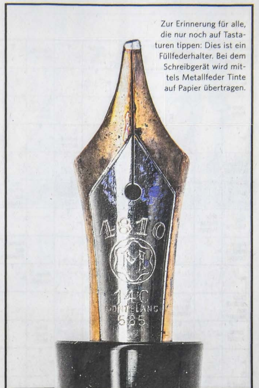
Zur Erinnerung für alle, die nur noch auf Tastaturen tippen: Dies ist ein Füllfederhalter. Bei dem Schreibgerät wird mittels Metallfeder Tinte auf Papier übertragen.