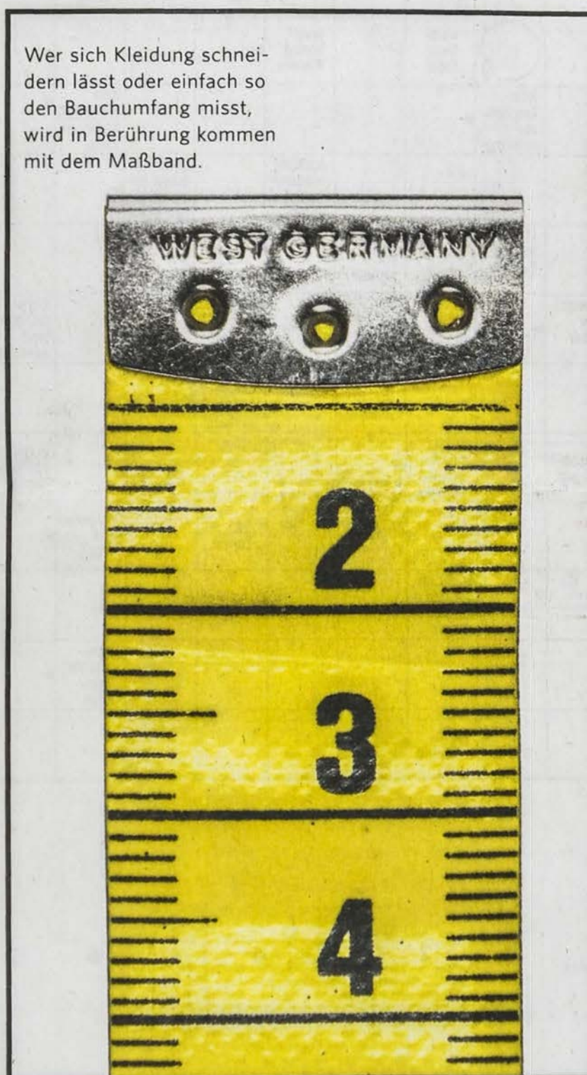
Wer sich Kleidung schneiden lässt oder einfach so den Bauchumfang misst, wird in Berührung kommen mit dem Maßband.

Andrea Wittstruck fotografiert Dinge, die der Welt womöglich abhandenkommen. Sie setzt die Gegenstände nackt und ohne Hintergrund in Szene und betont so deren eigentümliche Schönheit.