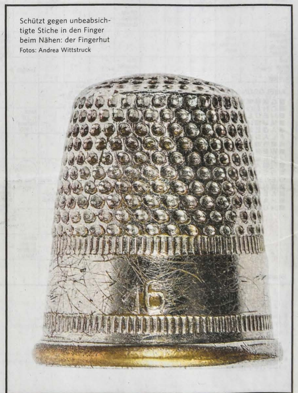
Schützt gegen unbeabsichtigte Stiche in den Finger beim Nähen: der Fingerhut